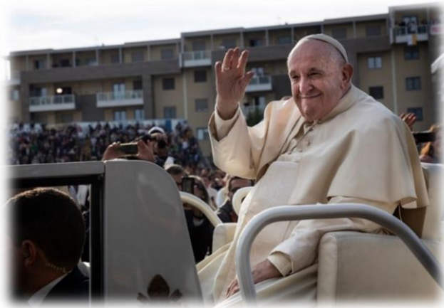
Papa Francesco a Matera per la conclusione del Congresso Eucaristico Nazionale

cristiani la speranza ha un nome: Cristo Gesù (1 Tim 1,1), che ha distrutto la morte e vive per sempre. E noi, che ci gloriamo del nome di cristiani, cioè appartenenti a Cristo, quindi di Cristo, «non siamo più stranieri né ospiti, ma concittadini dei santi e familiari di Dio» (Ef 2,19). E S. Paolo spiega: «se siamo figli, siamo anche eredi: eredi di Dio, coeredi di Cristo» (Rm 8,17).