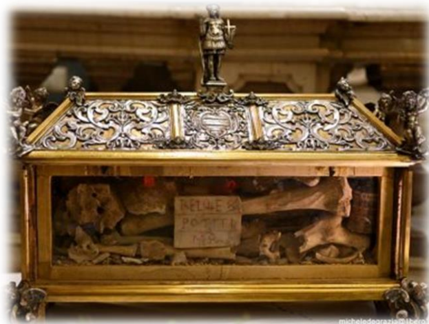
Reliquie di S. Potito