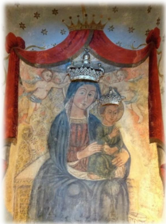
Madonna del Santuario di Fonti

Santuario Mariano Diocesano, avviando la Peregrinatio della Madonna del Carmine e delle reliquie di San Potito. La Peregrinatio, intitolata « Pellegrini di speranza con Maria e San Potito », è stata organizzata nell'ambito dell'“Anno della preghiera”, iniziato da Papa Francesco il 21 gennaio 2024 in preparazione al Giubileo del 2025. L'evento, che si svolgerà in tutte le comunità diocesane, culminerà con l'apertura dell'Anno giubilare nella cattedrale di Tricarico il 28 dicembre.